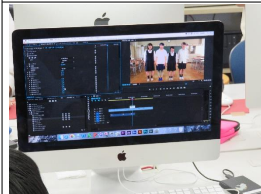
編集ソフトの画面