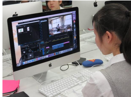
音量調整やテロップを加えていく