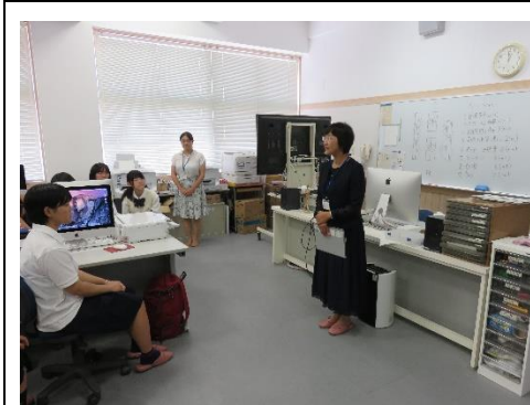
笠間高の稲見学校長から挨拶