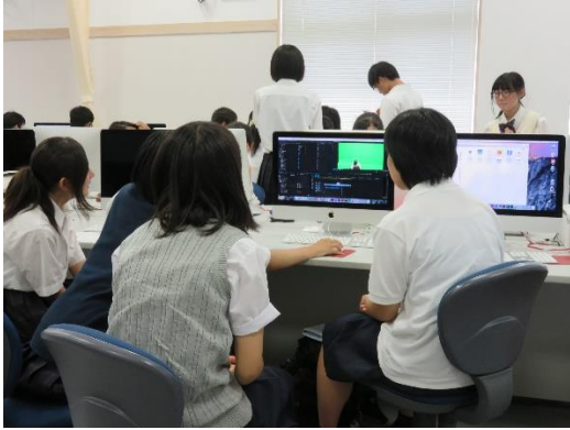
笠間高生にリードしてもらい作業する