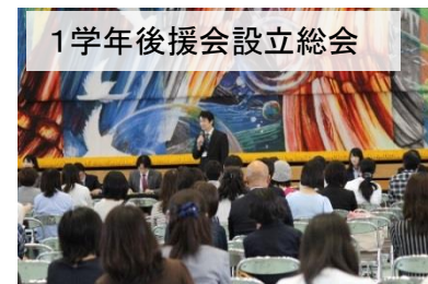
1学年後援会設立総会