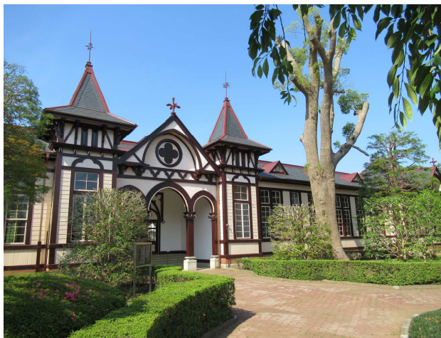
旧土浦中学校本館

赴任してわずか2年3ヶ月の在職中に、新進気鋭の県技師として昼夜を問わず精力的に設計・監理に当たりました。この間、旧土浦