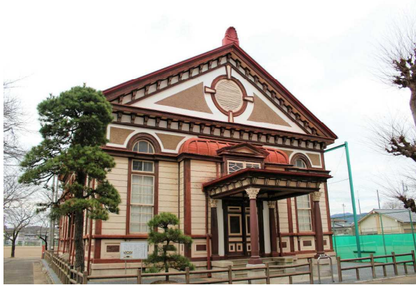
旧太田中学校講堂

中学校本館，旧太田中学校講堂（現太田一高），旧商業学校本館（現水戸商高），旧龍ヶ崎中学校