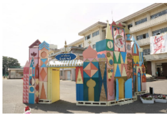
△ 平成28年度一高祭ゲート

今年度は創立120周年記念の一高祭ですので、様々な企画を用意しています。今や一高名物となった“ゲート”が皆様をお迎えします。昨年は「It's a Small World」でしたが、さて今年は・・・? 見どころたくさん「一高祭」に是非いらしてください。